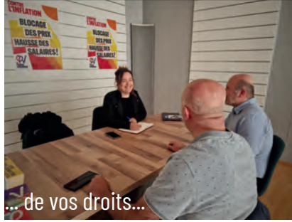
... de vos droits...