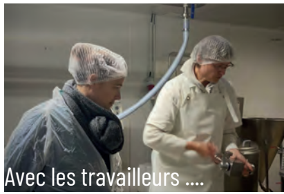
Avec les travailleurs ....