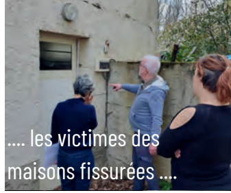
.... les victimes des maisons fissurées ....