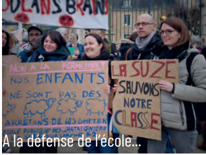
A la défense de l'école...