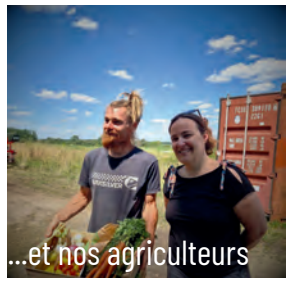
...et nos agriculteurs