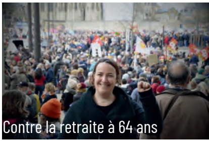
Contre la retraite à 64 ans