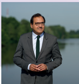
Christophe Chaillou Sénateur du Loiret

Notre pays est confronté à un choix crucial, un choix historique pour notre démocratie et pour les valeurs fondamentales de la République. Face à l'écroulement de la majorité présidentielle, face au risque de chaos que représenterait l'extrême droite au pouvoir, seule la gauche incarne aujourd'hui l'espoir et l'alternative républicaine. Je connais bien Emmanuel DUPLESSY et je sais combien sa présence à l'Assemblée Nationale permettra d'apporter les réponses concrètes à vos préoccupations pour plus de pouvoir d'achat et une vraie justice sociale, pour la solidarité et l'accès aux soins, pour un nouveau modèle de développement protecteur de la planète mais aussi pour faire vivre la démocratie, les valeurs républicaines dans une société apaisée et respectueuse de chacune et chacun.